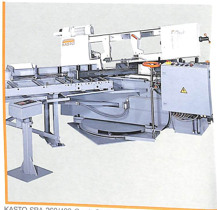
KASTO SBA 260/400 G mit CNC Meßanschlag und Rollenbahn (Zubehör)