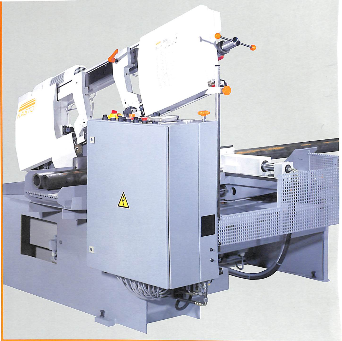
KASTO SBA 260 AU